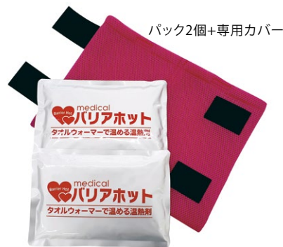
パック2個+専用カバー

腕や脚に使用しやすいスリムなサイズ。2個組なので両脇に当てるなど効果的に使用できます。