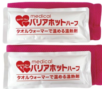
バリアホット・ハーフ